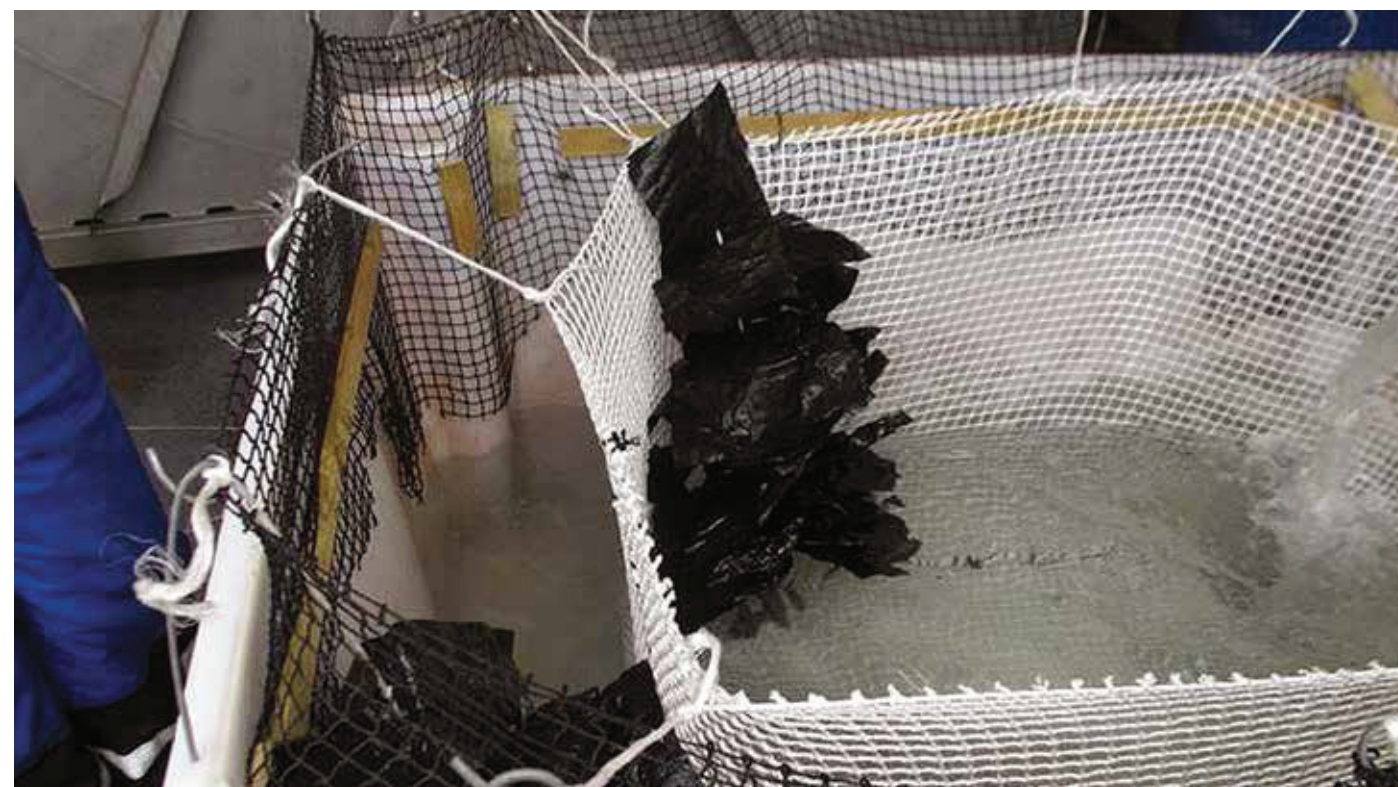
Figur 2. Forsøkskar for rømmingsforsøk fra 38 omfars not.

Minstemålet ved fisket på leppefisk i det meste av Norge har vært 11 cm i 2011, 2012 og også inneværende år, 2013. Nord av Trondhjemsfjorden var minstemålet 9 cm i 2011, med forandret til 10 cm i 2012 og 2013. Ut fra forsøket beskrevet her og tidligere forsøk er det klart at oppdretterne må være svært påpasselige med hvilke fis-