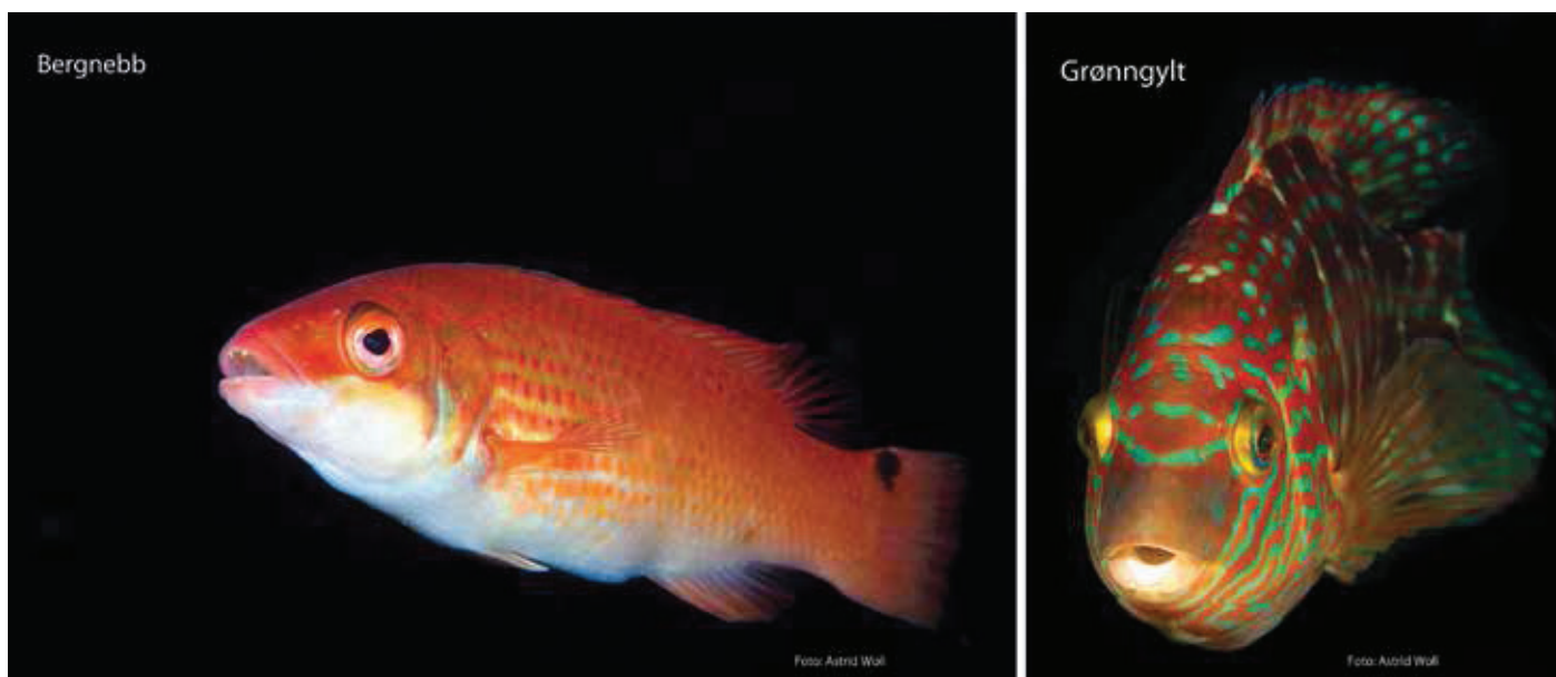
Figur 1. Bergnebben (1A) har en slank kroppsfasong i forhold til den mer høyreiste grønngylta (1B). Dette gjør at anbefalt lengde for bergnebben er noe lengre for de ulike maskeviddene.

Hvert år settes millioner av leppefisk i laksemerdene for å kontrollere lakselus. Det blir meldt om et betydelig og uforklarlig svinn av disse lusespiserne. En av årsakene kan være rømming. Mye av leppefisken som brukes er lokalfanget, og da mest bergnebb og grønngylt. Det transporteres også leppefisk mellom regioner, spesielt importeres mye fra Sørlandet og den svenske vestkysten.