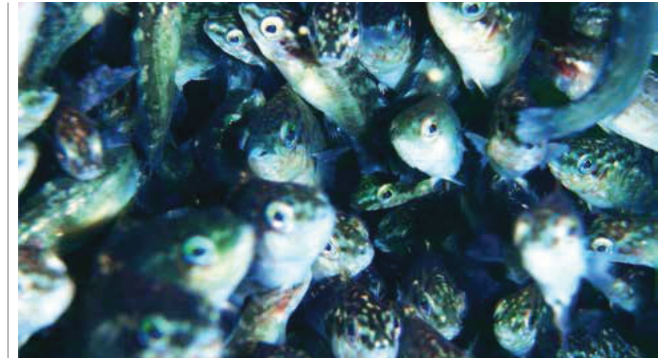
Oppdrettet berggylt fra Havforskningsinstituttet, den samme som senere inngikk i forsøket beskrevet her.

Berggylt har gått fra å være en leppefiskart en ikke kunne bruke som luseplukker i den tidlige fasen der leppefisk ble brukt som luseplukker, til å bli den foretrekkende arten for oppdretterne. Arten er robust og en god luseplukker. Imidlertid er det heller lite av den langs kysten. Gjennomsnittlig er 2 % av fangstene av leppefisk berggylt. Berggylt ble derfor den naturlige valgte arten da en tenkte på oppdrett av leppefisk. De første oppdrettede berggyltene ble klekt på Havforskningsinstituttet sin forskningsstasjon på Austevoll på midten av 90-tallet, men etter at andre avlusingsmetoder enn-